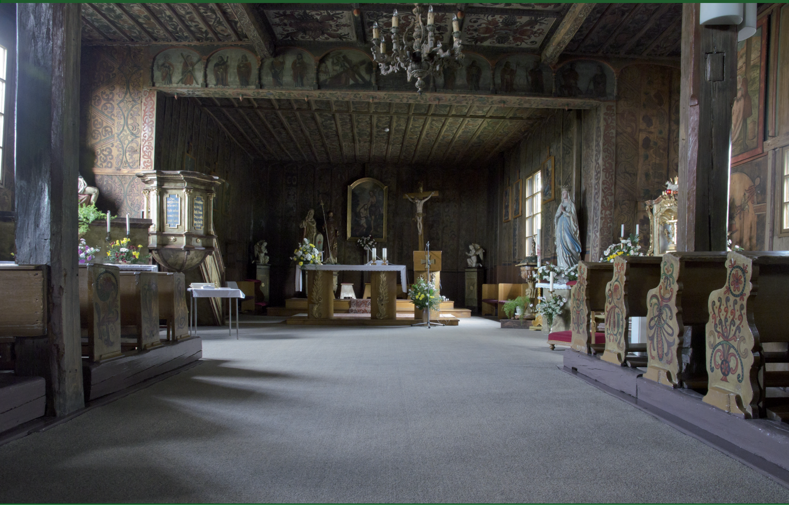
Interiér kostela sv. Jana Křtitele ve Slavonově u Nového Města nad Metují.