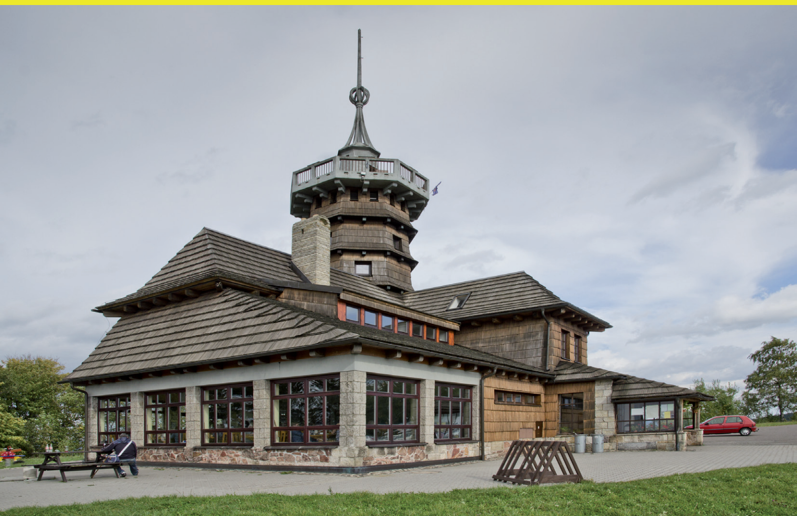
Jiráskova chata na Dobrošově nad Náchodem - pohled od západu.

ČLÁNKY - INFORMACE - AKTUALITY - NÁZORY- FOTOGRAFIE