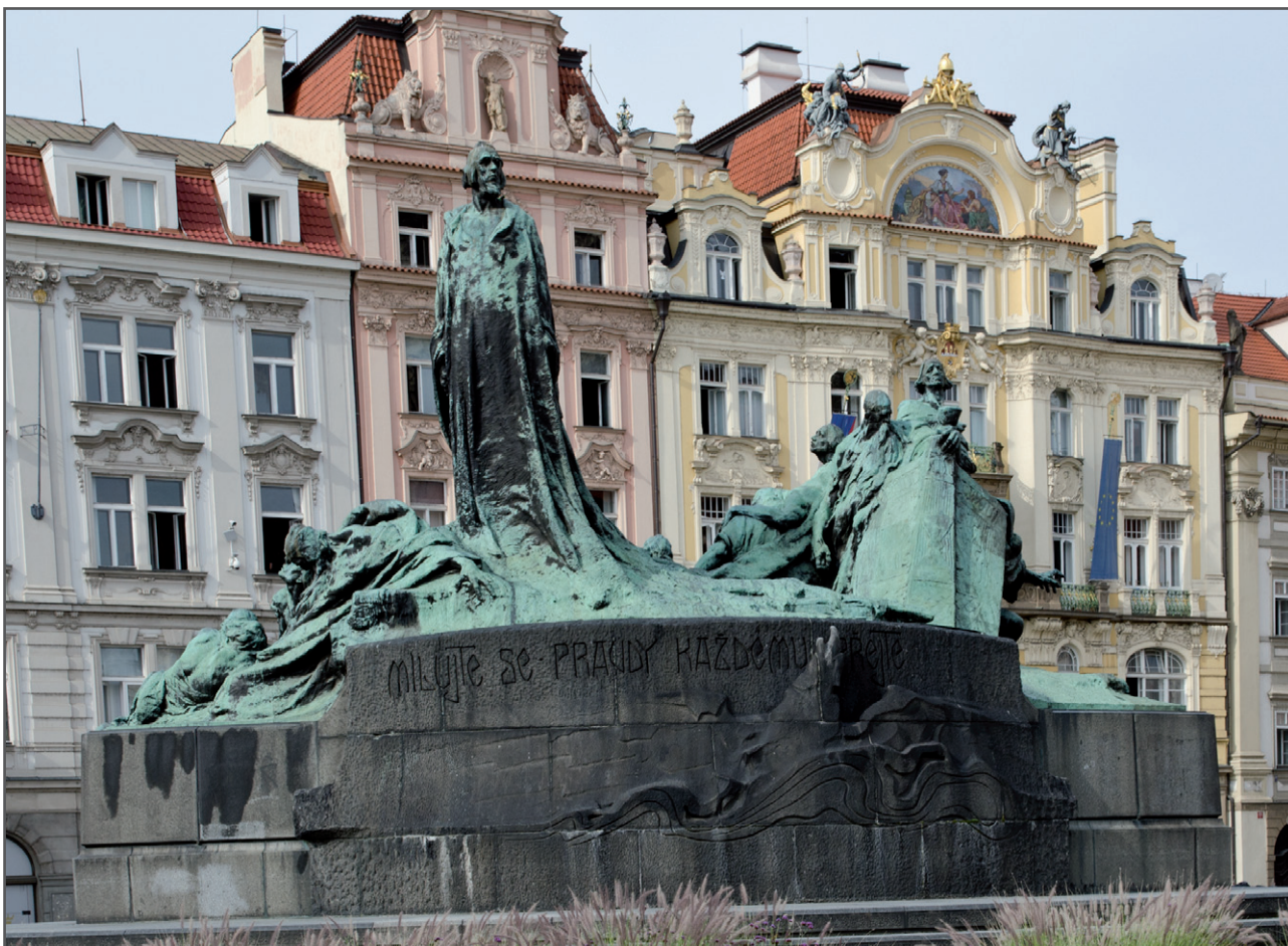
Sousoší s Janem Husem na Staroměstském náměstí v Praze.