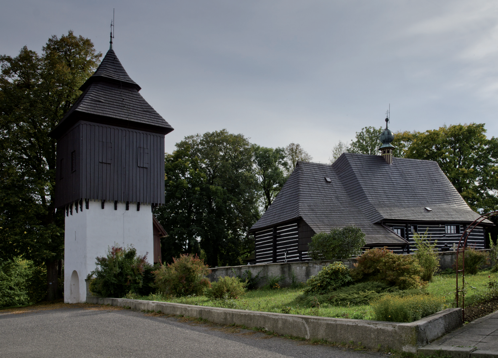
Kostel sv. Jana Křtitele ve Slavonově u Nového Města nad Metují.