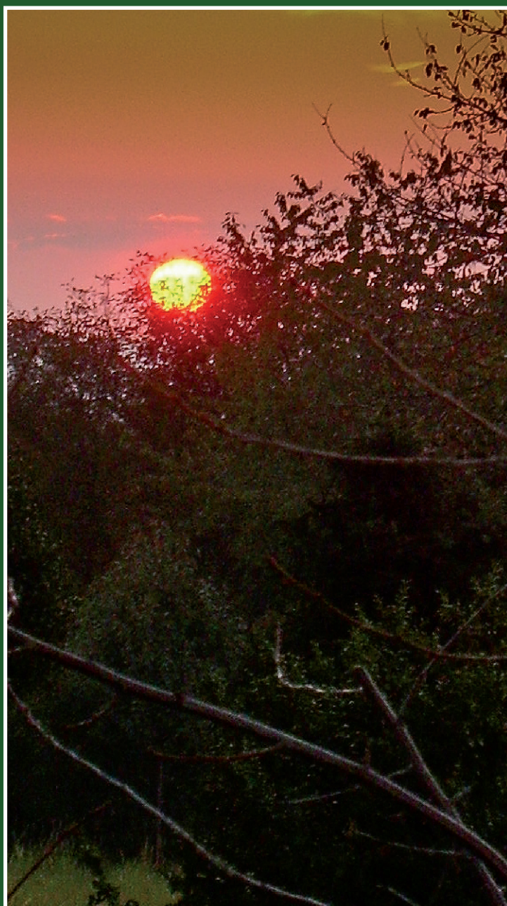
Zapadá sluníčko za hory....