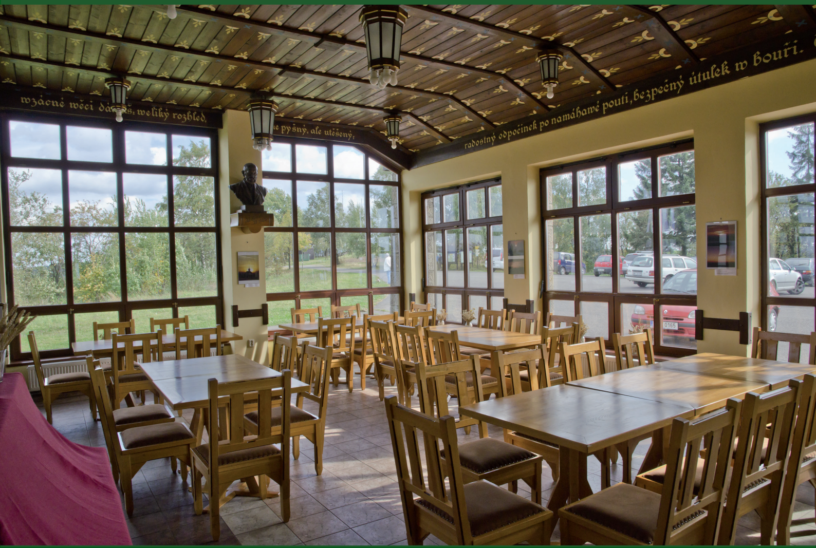
Interiér Jiráskovy chaty na Dobrošově - jídelna