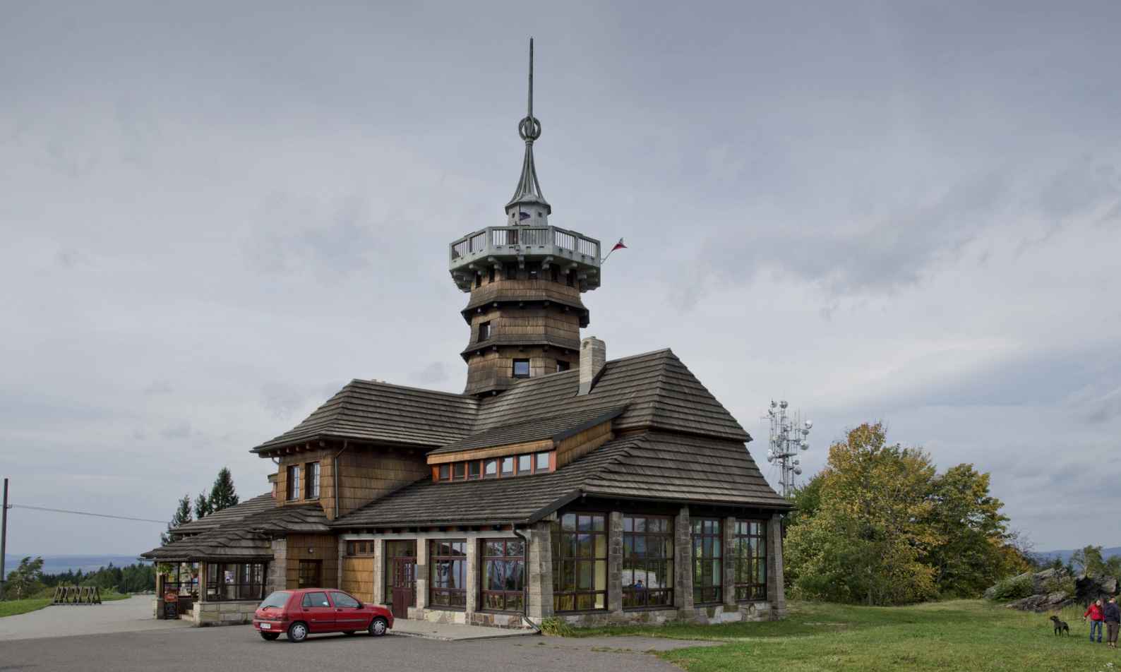
Jiráskova chata na Dobrošově nad Náchodem - pohled od východu.